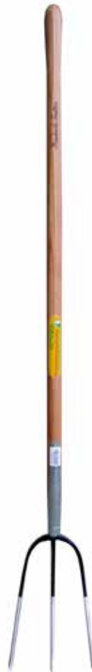
品番: G7640 3本爪 - 120cm 柄の長さ