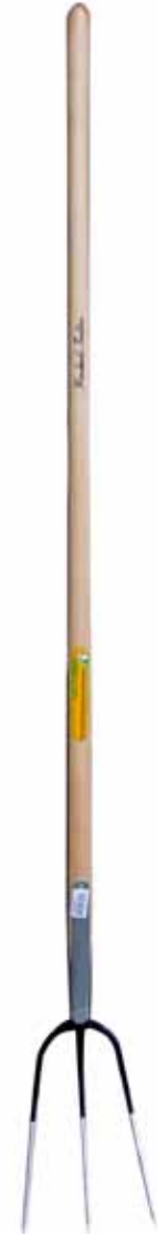
品番: G7641 3本爪 - 150cm 柄の長さ