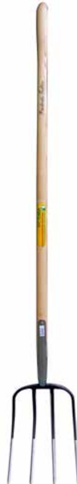
品番: G7642 4本爪 - 120cm 柄の長さ