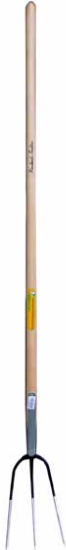
品番: G7641 3本爪 - 150cm 柄の長さ