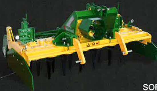
SOFT 9 - 11 - 13 - 15 - 17 - 19 1.000 - 2.500 35 - 120