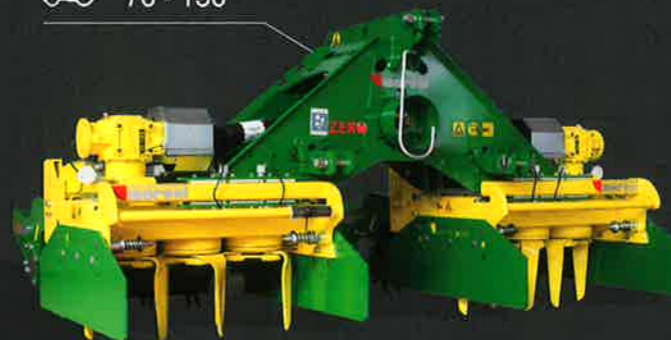
EKSI 1.000 - 4.000 50 - 250