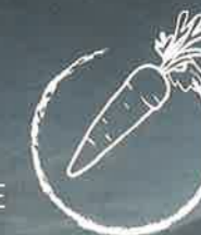
ZERO 2.120 - 2.720 70 - 150

HORTICULTURE DIVISION | SPARTE GARTENBAU DIVISIÓN DE HORTICULTURA | DIVISION DE L'HORTICULTURE