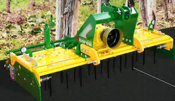
ASCOT 800 - 2.000 15 - 80

"I miei gusti sono semplici, sono facilmente soddisfatto dal meglio" "My tastes are simple, I am easily satisfied with the best" Winston Churchill, Politico