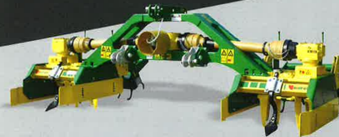
RULLO RETE 1.000 - 4.000 50 - 250