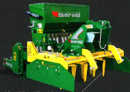
SHARP 120 - 200 1.000 - 2.500 35 - 120